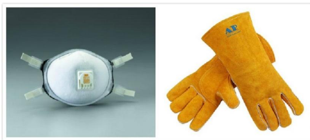
图 3 常规个人防护用品

尽可能采用放射剂量极低的钍钨极。钍钨极和钍钨极加工时，应采用密封式或抽风式砂轮磨削，操作者应配戴口罩、手套等个人防护用品，加工后要洗净手脸。钍钨极和钍钨极应放在铝盒内保存。