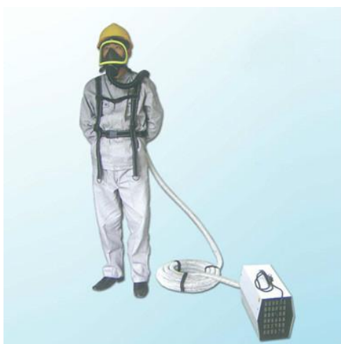
图 5 送风式头盔

氩弧焊时，由于臭氧和紫外线作用强烈，宜穿戴非棉布白色工作服。在容器内焊接又不能采用局部通风的情况下，可以采用送风式头盔、送风口罩或防毒口罩等个人防护措施。