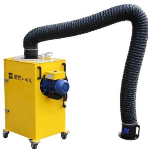
图 4 时代除尘设备