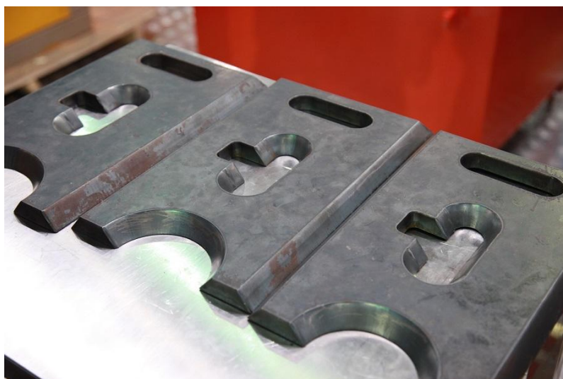
图 4：碳钢 80mm 切割效果